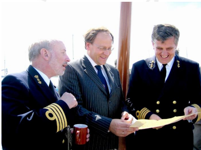
De 12e generatie houdt krijgsraad met zijn schippers.

Zo bont hebben de afstammelingen het niet gemaakt, maar wat zij wel hebben meegenomen van dit bezoek is een gevoel, dat hun voorvader niet voor niets op grootse wijze wordt herdacht in zijn 400 e geboortejaar.