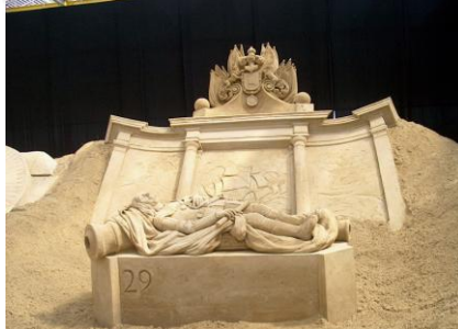
Het praalgraf in de Nieuwe Kerk te Amsterdam.