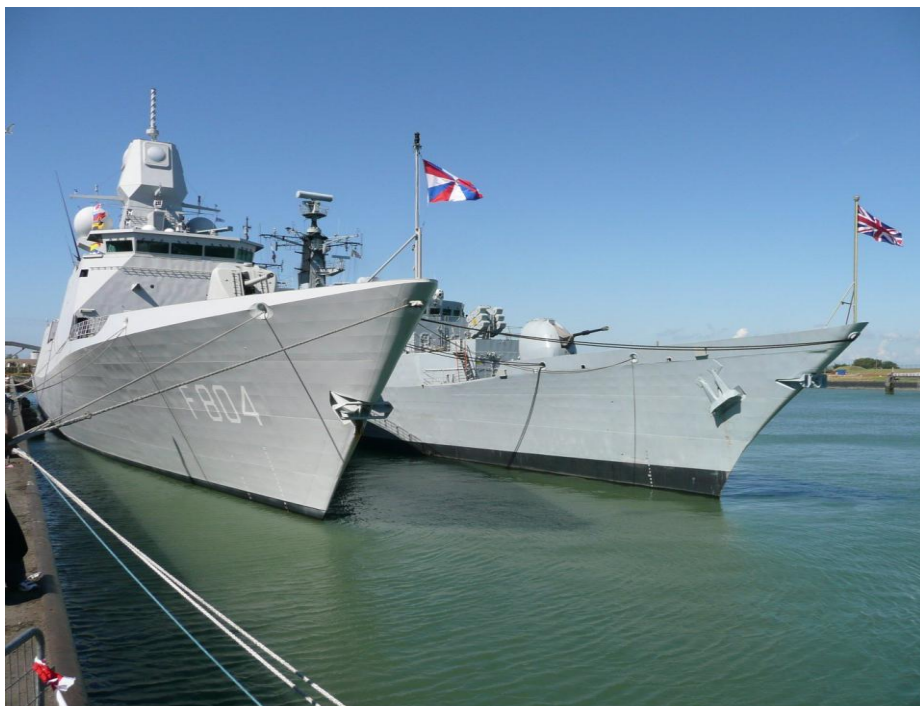
Zusterlijk naast elkaar afgemeerd: Hr.Ms. " de Ruyter " & HMS " Chatham " De Geus en de Union Jack wapperen in dezelfde richting. © Ir M. Doude van Troostwijk.