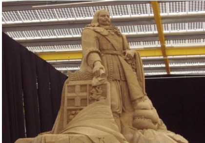
Intaminatis Fulget Honoribus

Tot 2 september zijn in de Floriadehal te Vijfhuizen. Diverse, uitstekende zandsculpturen te bewonderen, die in teken staan van 400-jaar Michiel de Ruyter.