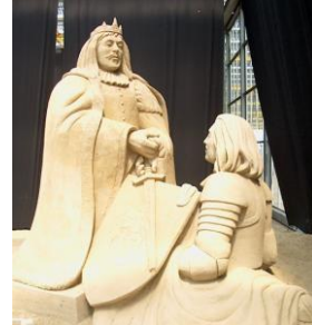
In de adelstand verheven door de Deense Koning.