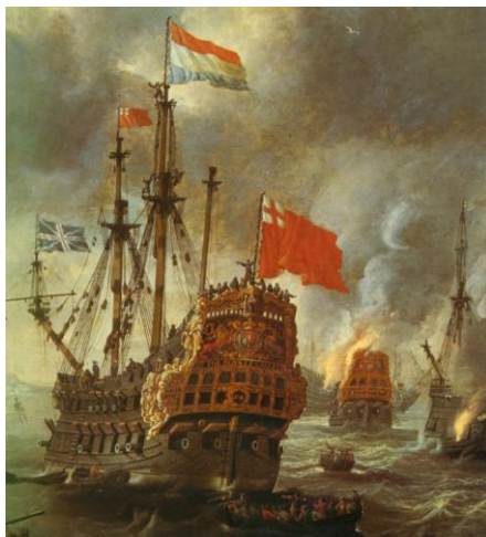
Het afvoeren van de " Royal Charles " met de Nederlandse vlag in top.

De genodigden konden ter plekke constateren, dat het vaarwater wel erg nauw is en het voor de schepen van Michiel een hele opgave moet zijn geweest de 12 zeemijl lange rivier op te varen. Daar hadden ze dan ook een week over gedaan. Kasteel Upnor bleek enigszins voorbereid te zijn op de komst van de Hollanders, maar was niet in staat te voorkomen dat het vlaggenschip, de " Royal Charles " werd afgevoerd.