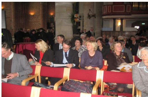
H.M. is er nog niet, maar de nazaten vullen de kerk al.

Opening van het DE RUYTER-JAAR op 23 maart 2007 door Hr Ms Koningin Beatrix in de Jacobskerk te Vlissingen.